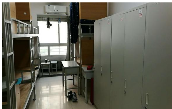
▲ 国防生宿舍全体实现“人离屋净”