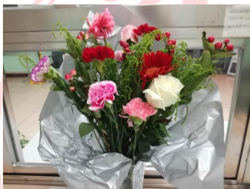
▲ 住宿学生向品园5楼值班台送去的鲜花