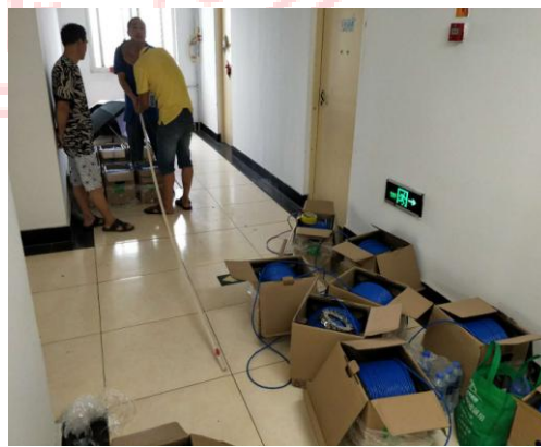
▲ 上图为红楼屋面防水工程，下图为网络布线工程