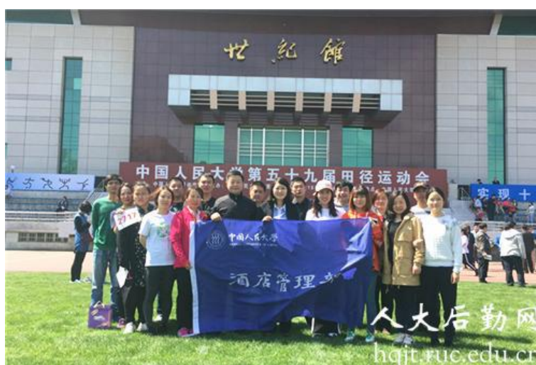
▲ 酒店管理部分会参加运动会