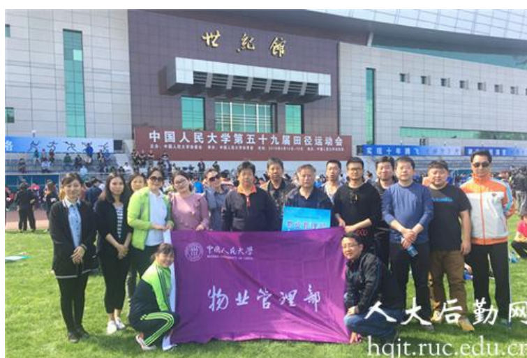
▲ 物业管理部分会参加运动会

4月11日-14日，中国人民大学第五十九届田径运动会在世纪馆田径场隆重举行。后勤集团各分会认真准备，积极参与，本着“友谊第一，比赛第二”的理念参加比赛，在多个项目上都表现优异。