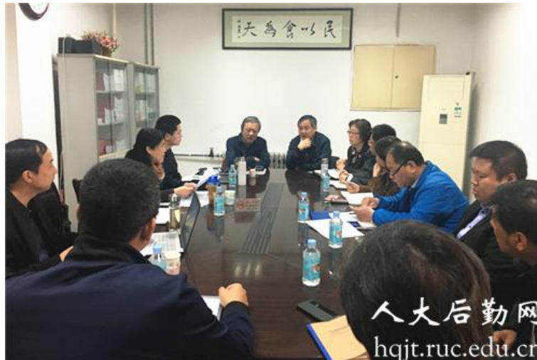
▲ 餐饮系统 ISO9001 和 ISO22000（食品安全管理体系）监督审核会