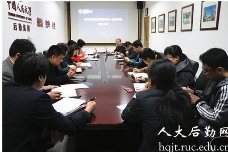
▲ 物业服务系统 ISO9001 监督审核会

4 月 11 日-13 日，后勤集团开展质量管理体系认证 2018 年度监督审核工作，并顺利通过中国检验认证集团的审核。